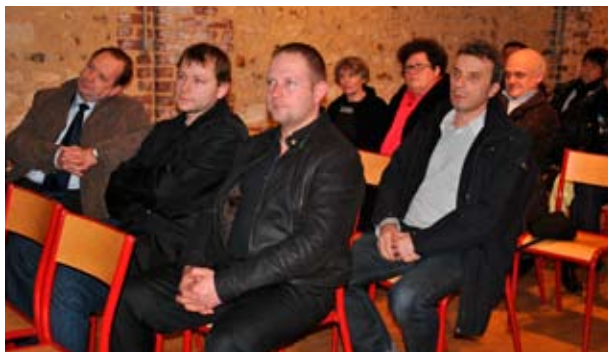
Les commerçants et artisans de la ville ont été reçus par le maire et son conseil.

Du centre commercial Kennedy, de la place de l'église, du Chapitre et d'ailleurs, ils se sont rendus à la Grange, le lundi 10 janvier dernier. La rencontre a été l'occasion pour le maire d'évoquer les projets à venir : l'extension de la crèche, les travaux à l'Espace Corneille, la construction d'une nouvelle salle des fêtes, l'aménagement des différents quartiers de Bihorel ou encore le possible rapprochement avec la commune de Bois-Guillaume.