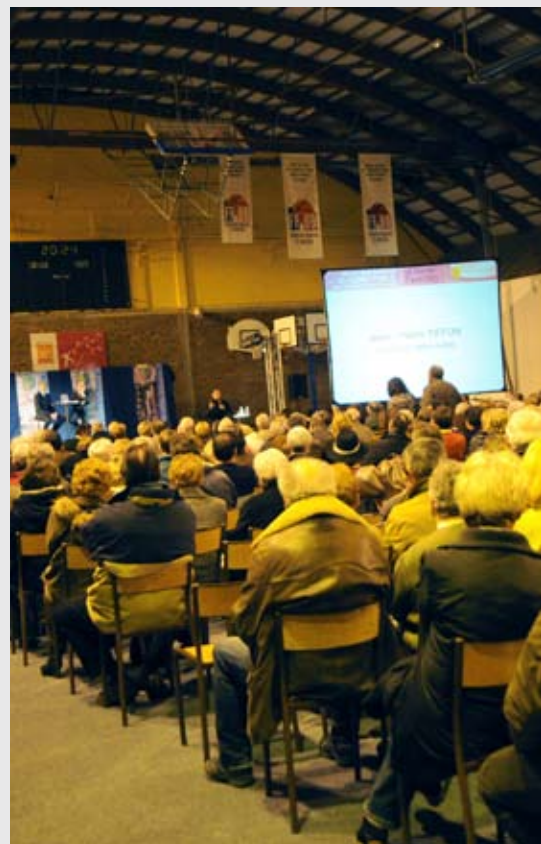
Plus de 500 personnes étaient présentes à la réunion d'ouverture pour apporter leur contribution aux débats, le 10 février dernier.