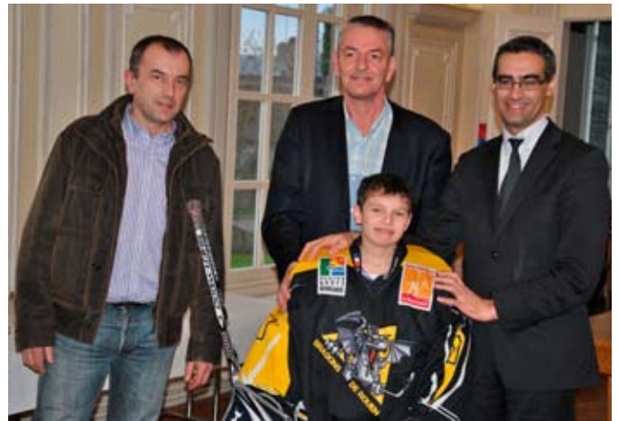
A seulement onze ans, ce jeune Bihorellais a participé au plus grand tournoi de hockey sur glace mineur au monde, au Québec.

La Ville a félicité le jeune sportif et lui a remis un grand sac de sport pour transporter son impressionnant équipement et un bon d'achat de 100 euros dans un magasin de sports.