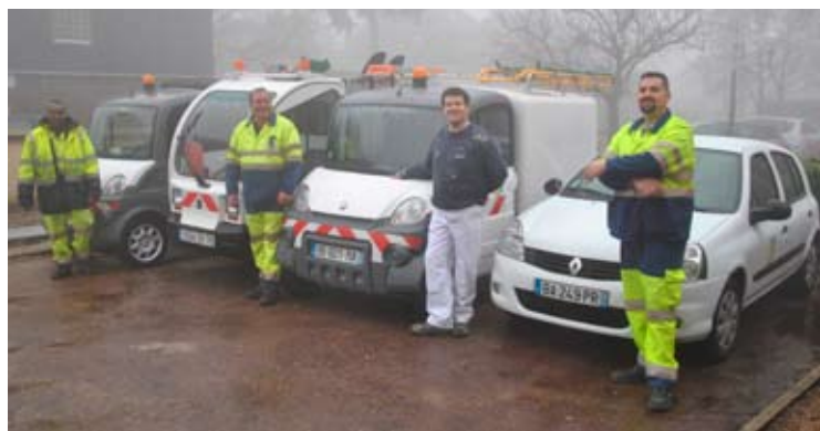
La flotte motorisée des services techniques de la Ville compte désormais quatre véhicules propres pour vingt véhicules à moteur.

D'un coût de 20 884 euros, le fourgon Méga a été en partie subventionné par l'Agence de l'environnement et de la maîtrise de l'énergie. Si le prix à l'achat est plus élevé que celui d'un véhicule à moteur classique, il sera rapidement amorti. Car côté carburant, c'est zéro dépense. Sans compter que les frais d'entretien sont limités.