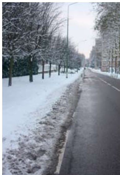
Un circuit de salage est organisé sur les 35 km de voirie que compte la commune.

Le plan déneigement de la Ville a pu démontrer cette année encore sa grande efficacité. Actif du 22 novembre dernier au 13 mars et mis au point par les services techniques municipaux, il a été enclenché à seize reprises durant la saison hivernale.