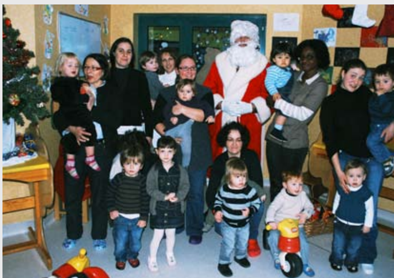
Un Noël magique pour les enfants de la crèche avec la visite du Père Noël un jour de neige.